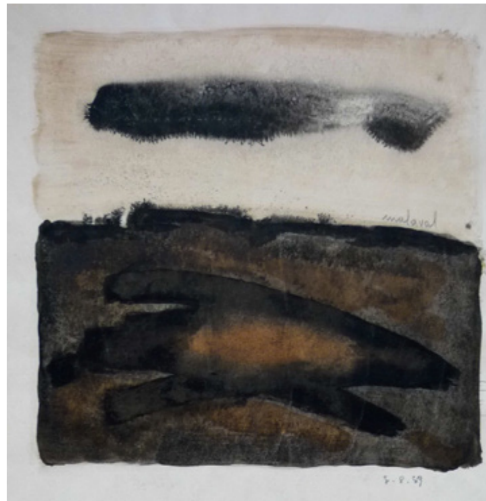
Robert Malaval Coupe Carrée Encre sur papier 42,5 x 52,5 cm 1959