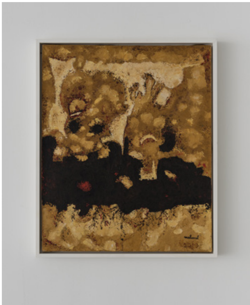
Robert Malaval Nihilisme grignotant Huile sur toile 50 x 60 cm 1959